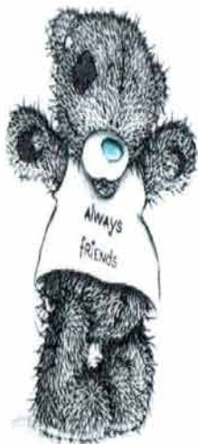
Veroni a Natty =)